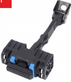
Oe Ref: 8X3837249C DOOR CHECK STRAP A1 (2011-...) FRONT RIGHT , FRONT LEFT