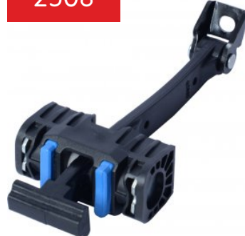
Oe Ref: 8K0839249D DOOR CHECK STRAP A4 [ 8K ] (2008 - 2015) S4 [ 8K ] (2008 - 2015) REAR RIGHT , REAR LEFT