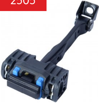
Oe Ref: 8V4837249A DOOR CHECK STRAP A3 [ 8V ] (2013 - ...) S3 [ 8V ] (2013 - ...) FRONT RIGHT , FRONT LEFT