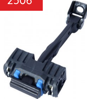
Oe Ref: 8V4839249A DOOR CHECK STRAP S3 [ 8V ] (2013 - ...) A3 [ 8V ] (2013 - ...) REAR RIGHT , REAR LEFT