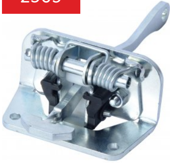
Oe Ref: 8Z0837249 DOOR CHECK STRAP A2 (2001 - 2005) FRONT RIGHT , FRONT LEFT