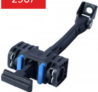
Oe Ref: 8K0837249D DOOR CHECK STRAP A4 [ 8K ] (2008 - 2015) S4 [ 8K ] (2008 - 2015) FRONT RIGHT , FRONT LEFT