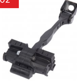
Oe Ref: 8X4839249C DOOR CHECK STRAP A1 (2011-...) REAR RIGHT , REAR LEFT