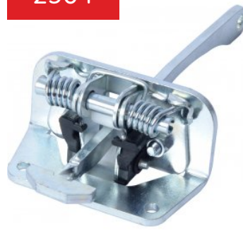
Oe Ref: 8Z0839249 DOOR CHECK STRAP A2 (2001 - 2005) REAR RIGHT , REAR LEFT